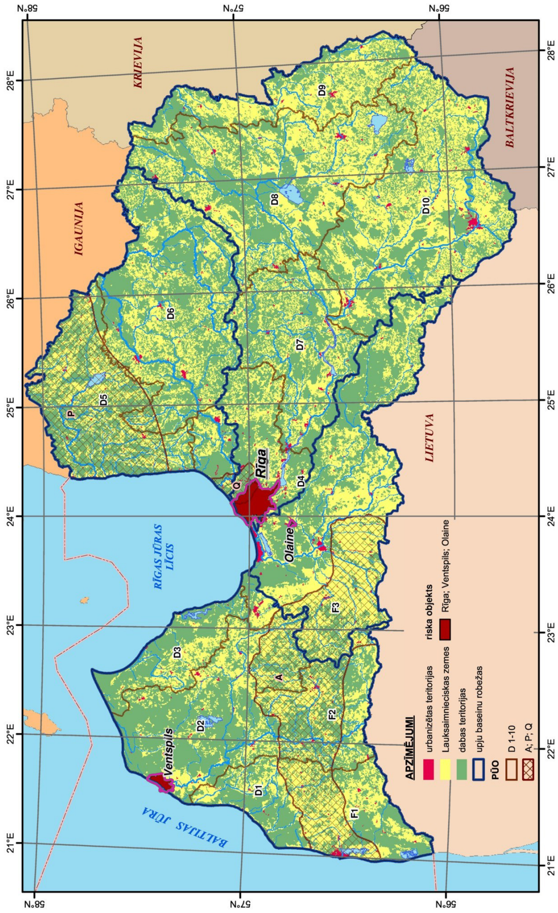
3.2.2.1.attēls Izklidētais piesārņojums