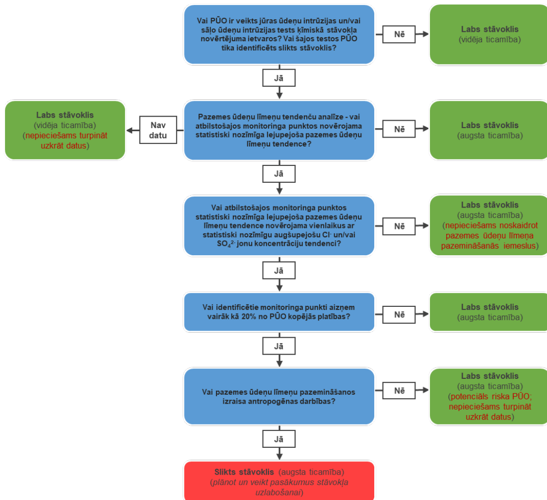
2.attēls. Jūras ūdeņu un sāļo ūdeņu intrūzijas testu novērtēšanas shematiskā procedūra

PŪO ķīmiskā stāvokļa novērtējuma – ja atbilstošajā testā ķīmiskā stāvokļa novērtējuma ietvaros netika identificēts slikts PŪO ķīmiskais stāvoklis, tad arī kvantitatīvā stāvokļa ietvaros atbilstošajā testā PŪO tika piešķirts labs kvantitatīvais stāvoklis (ar vidēju ticamības līmeni) (2.attēls).