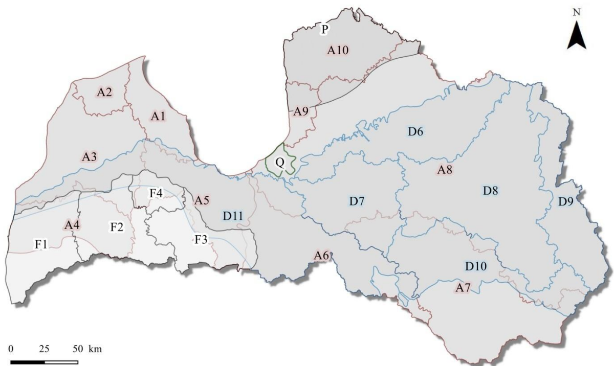
2.attēls. Jaunizdalīto 22 Latvijas pazemes ūdensobjektu robežas