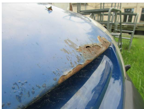
Citroen Berlingo (GP4163)