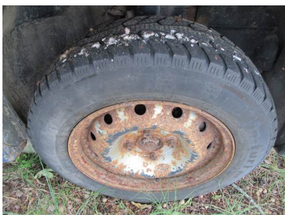
Citroen Berlingo (GP4163)