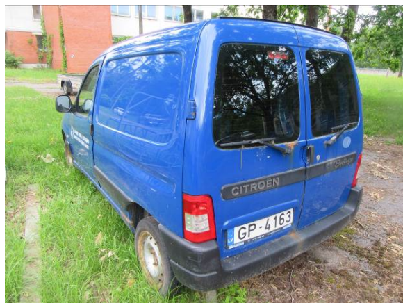
Citroen Berlingo (GP4163)