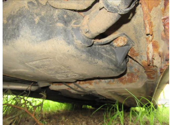
Citroen Berlingo (GP4163)