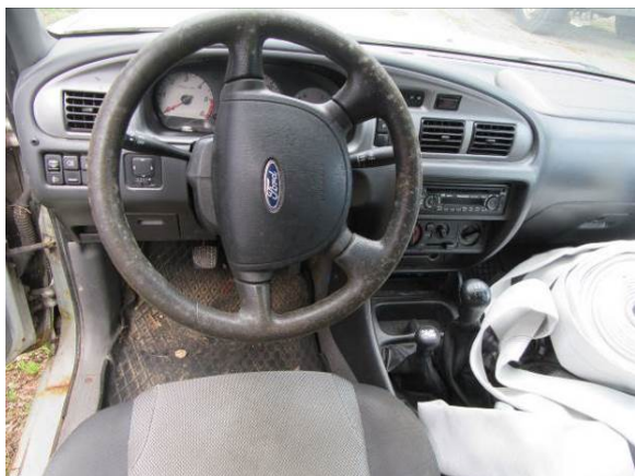
Ford Ranger (FM5661)