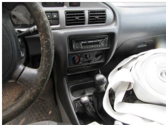
Ford Ranger (FM5661)