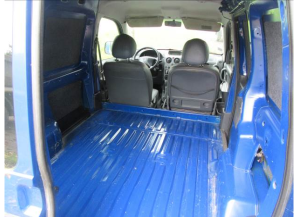
Citroen Berlingo (GP4163)