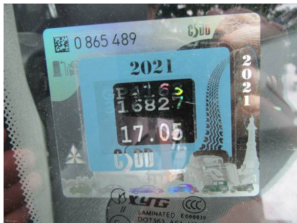
Citroen Berlingo (GP4163)