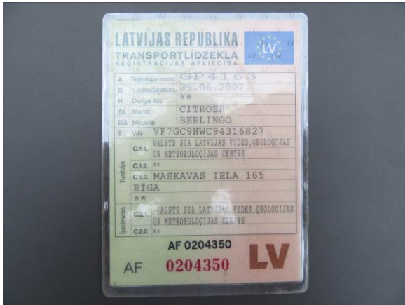
Citroen Berlingo (GP4163)