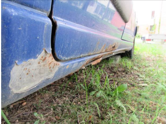
Citroen Berlingo (GP4163)