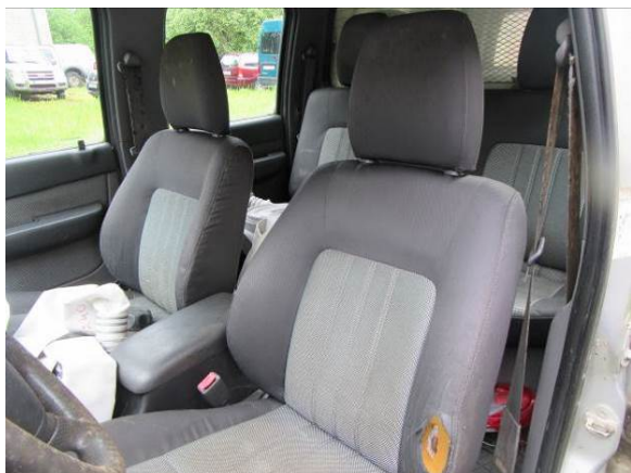
Ford Ranger (FM5661)