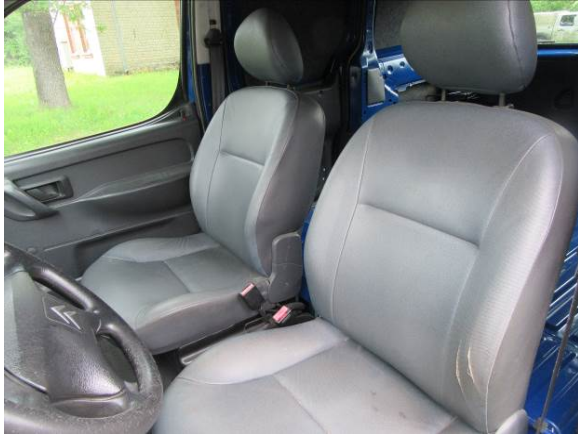
Citroen Berlingo (GP4163)