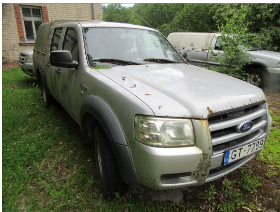
Ford Ranger (GT7789)