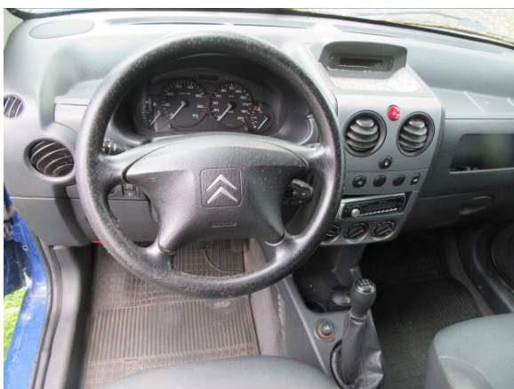
Citroen Berlingo (GP4163)