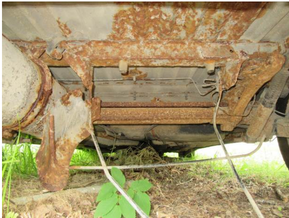
Citroen Berlingo (GP4163)