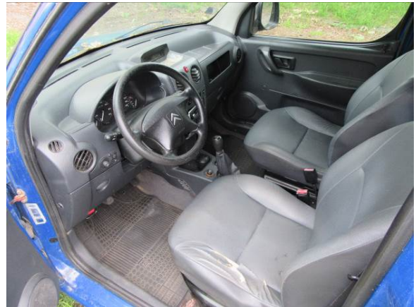
Citroen Berlingo (GP4163)