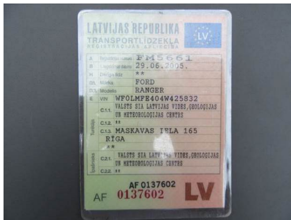
Ford Ranger (FM5661)