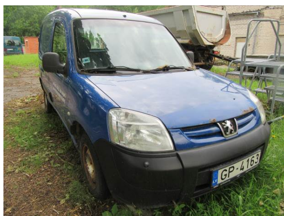
Citroen Berlingo (GP4163)