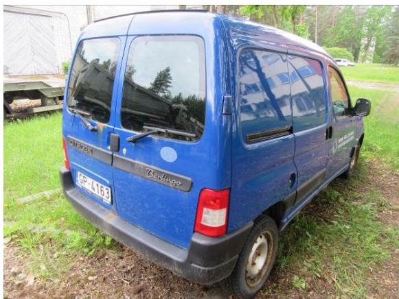
Citroen Berlingo (GP4163)