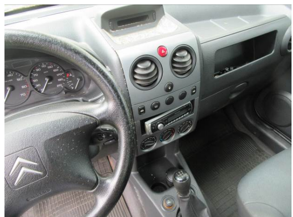
Citroen Berlingo (GP4163)