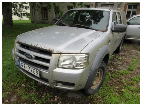
Ford Ranger (GT7789)