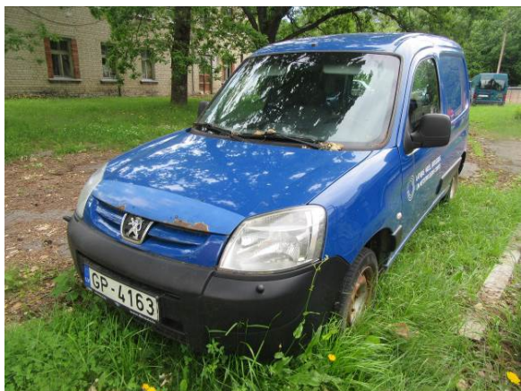
Citroen Berlingo (GP4163)